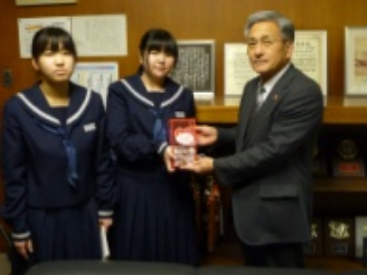
[上]厚岸中学校生徒会