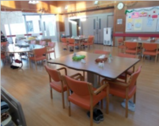
きれいな木目調のフロアとお揃いの新品イスで雰囲気が一新した多目的スペース

デイサービスセンターでは、去る11月末に大掛かりなフロア改修を行い、この改修に併せて備品も更新いたしました。 フロア改修の箇所は、利用者が一日を過ごす時間が最も長い多目的スペースで、従来のじゅうたん生地のものから、安全面と衛生面を