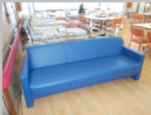
座って、伸ばして、くつろいで、簡単操作でくつろぎのカタチを演出できるソファベット