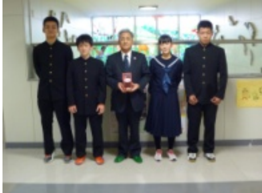
[上]高知小中学校児童会・生徒会