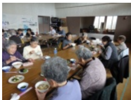
[上]上尾幌での会食会の様子