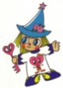
しゃっきーは厚岸町社協のシンボルキャラクター名です。

■ボランテニア通信「なかよし」 平成28年度ボランテニア研修会 参加者を募集します」ほか